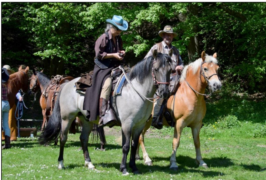
Så var det tid for bestefolket at drage afsted hjem