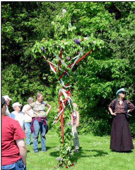
Fletningen blev siddende selv om den ikke blev så køn

Kl 12 var vi tilbage ved grusgraven og fik selskab af både hestevogn, ryttere mfl. og efter at have nydt den medbragte mad, dansede vi om majstangen og sang akkompagneret af harmonikaspil ved Dan Hansen.