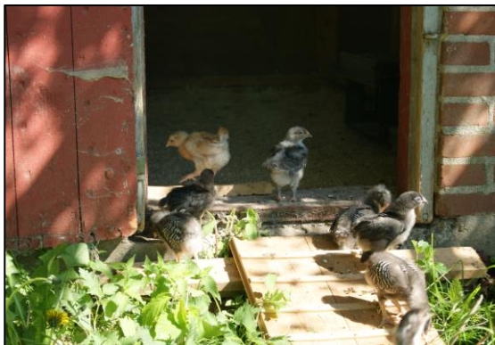
De mange små kyllinger

hønsene var glade og ”prisen” på æggene var igen i den høje ende.