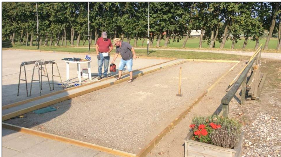
Efter hævrværk er petanquebanerne repareret igen

13. august holdt vi klubmesterskab i Double. Der var 20 deltagere. Klubben gav morgenmad og spillerne medbragte selv kaffe og madpakker.