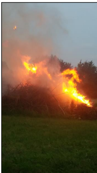
Der var gang i bålet