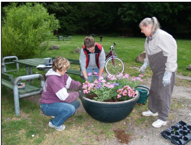
Det kan vi vidst godt være bekendt