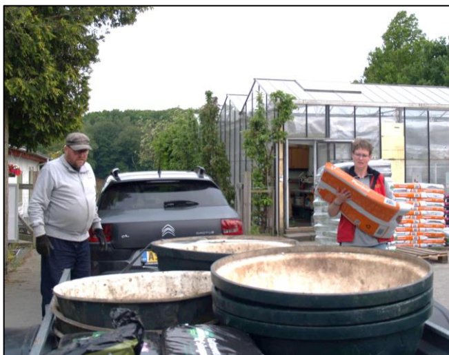
Så læsset der på Planteskolen

hendes initiativ og Flemmings Planteskole med donationen af blomster og jord. Blomsterkummerne har hver fået en "kontaktperson" fra byen, der sørger for den nødvendige vanding og pasning.