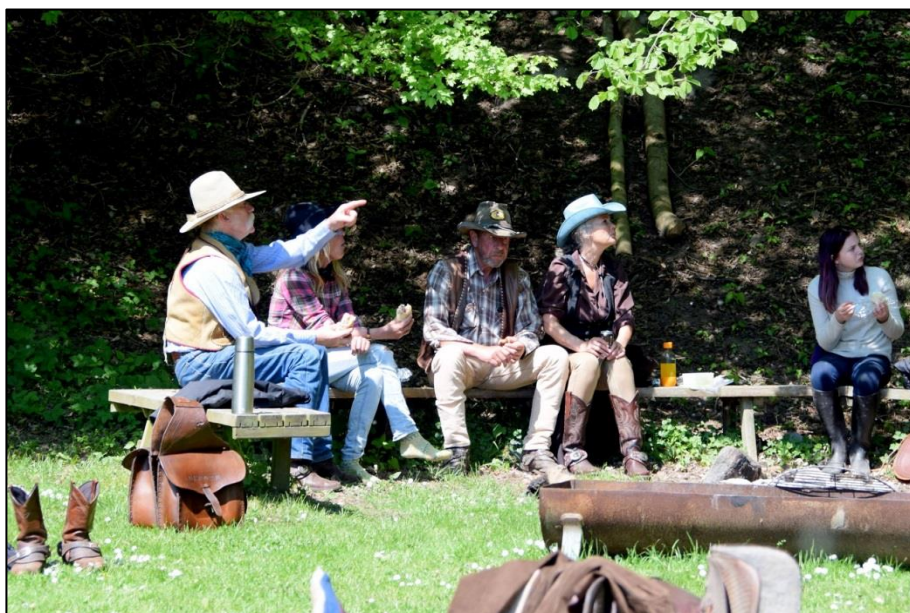
Også cowboys spiser frokosten i det grønne – Foto: Anzesa

Jeg håber alle ryttere og deres familier har lyst til at være med igen næste år.