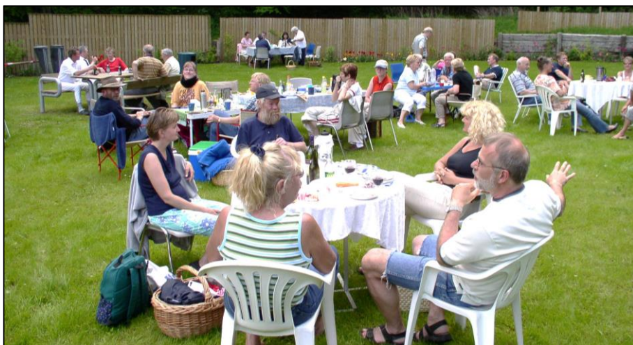
Indvielsen af grusgraven i 2003

Mød op og hjælp os med at fejre byens dejlige oase, Ugledige Grusgrav. Der vil være mulighed for at købe kaffe og øl/vand, men husk din egen madkurv og stol/bord, tæppe eller lignende for det er begrænset med siddepladser. Vejret har vi jo ingen indflydelse på, men da vi efterhånden må have noget ”sommervarme” til gode, håber vi at den rammer Ugledige den dag.