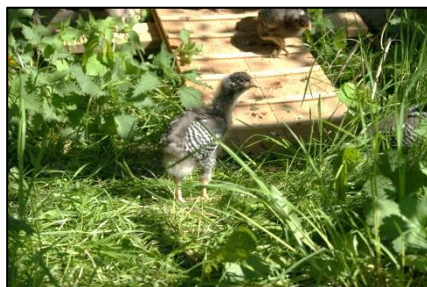
En af de mange hanekyllinger

linger til. Æg var det småt med, til gengæld begyndte kyllingerne at gale én efter én.