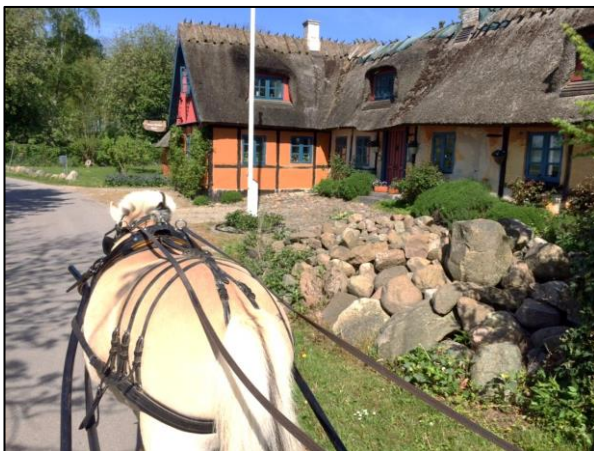
Udsigten fra bukken er altid god

Efter en dejlig frokost og sang om majstangen blev det tid at gøre hestene klar igen. Der er jo ligeså langt hjem igen som ud, og efter en times tid på vejen hjem, kunne vi sætte hestene på folden igen og sige tak for denne gang.