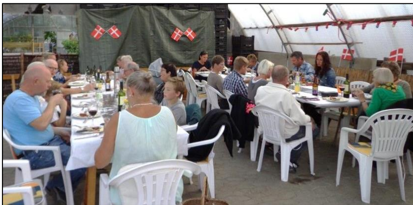
Der spises og konverseres