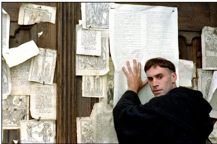
Joseph Fiennes spiller Martin Luther i filmen 'Luther' (2003). Han ses her slå sine tester op på kirkedøren

Der er arrangeret følgende som optakt til rejsen i Luthers fodspor