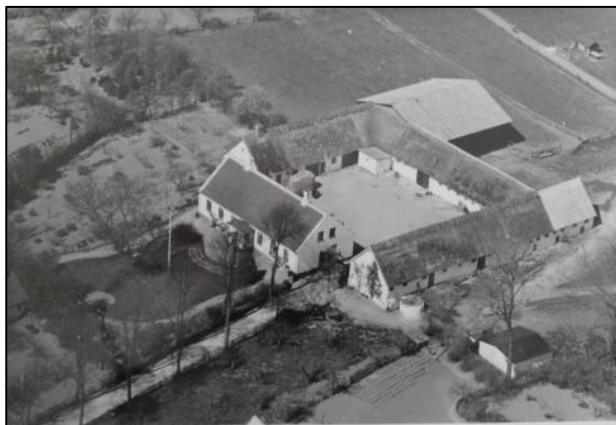
Banggården.