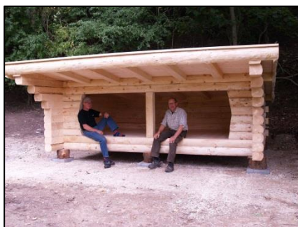
Arkiv foto fra sidste år

En varm tak til alle, der har hjulpet til med projektet.