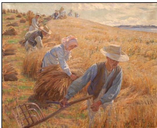
"Høstbillede" af den fynske maler Peter Hansen, 1910

Vi synger de gamle salmer om livets gang, om 'høsten her og høsten hist', og om 'alle gode gaver, der kommer oven ned'. Flere af salmerne stammer fra en længst forgangen tid, hvor arbejdsvilkår og tekniske muligheder var ganske andre end nu om dage. Peter Hansens maleri herunder kunne være en illustration til Grundtvigs 'Nu falmer skoven'.