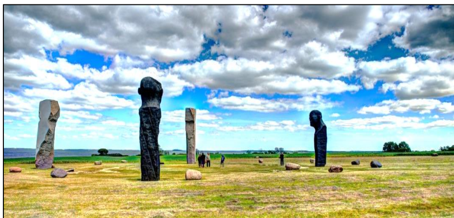
Dodekalitten ved Kragensås