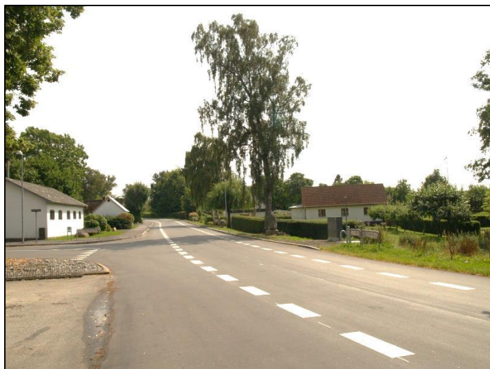
Afstribet vej i Allerslev