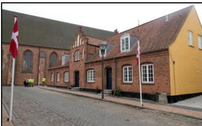
Det nye pilgrimshus ved Maribo Domkirke.

Besøg ved de mægtige stenkolosser og herunder medbragt kaffe, the og kage