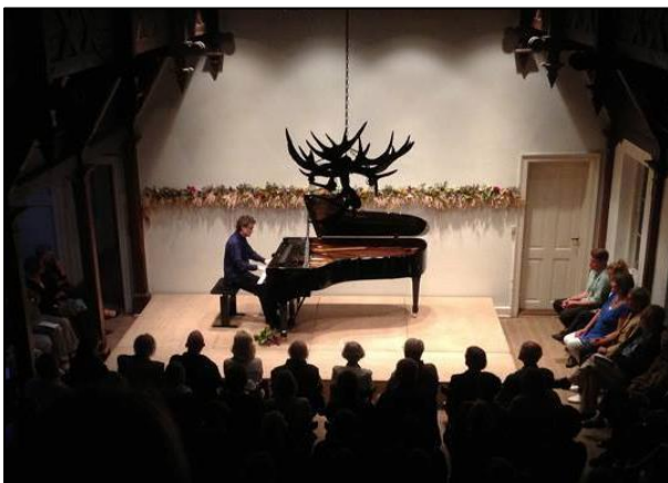
Billede fra Kammermusikfesten

”Det er et tilløbsstykke uden lige. Der er højt niveau hernede i de idyllisk smukke rammer. Og det er en