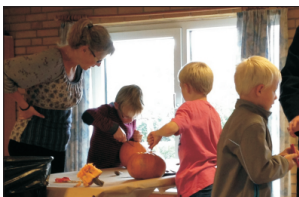
Drageveflying m.m s. 26