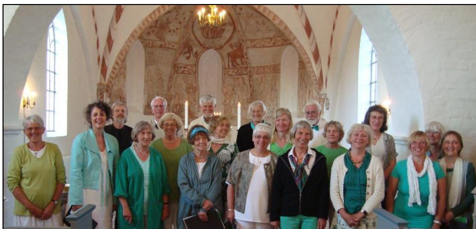
Horbelevkoret kommer til De Ni læsninger