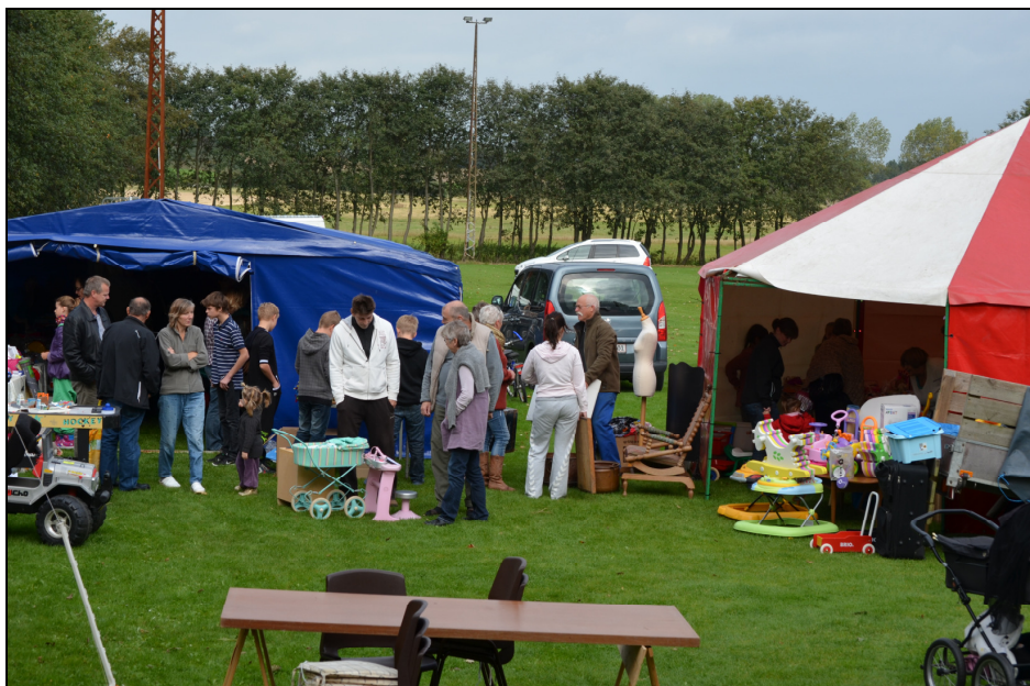
Det var dejligt at se så mange besøgende. Vi der var plads til flere.

Vi havde også sørget for underholdning til sognets børn, for motocross maskinerne var ude og køre og vi havde lejet en hoppeborg, der også blev flittigt brugt.