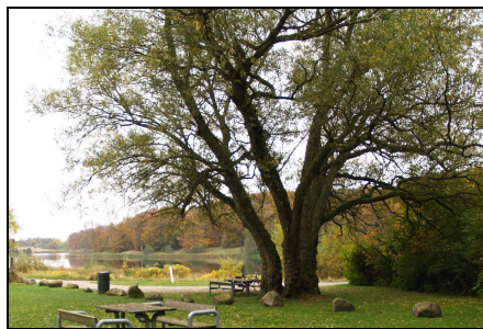
Det store flotte forsidefoto fra Ugledige grusgrav, er taget af Ove Rye Jørgensen.