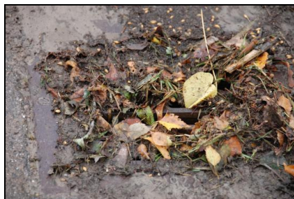
Sådan ser de små riste ud ved skybrud

Det vi har opnået indtil nu er, at man sandsynligvis får tilført midler til et ændret terrænavfandingsprojekt, hvor man vil imødegå oversvømmelserne fra markerne syd og øst for Allerslev. Vi er ligeledes blevet lovet, at der vil komme en dialog med vejvæsnet så vejafvandingen kan ske mere effektivt fremover. Endelig er der mulighed for at søge tilskud til ”område-fornyelse”. Dette har vi dog ikke gjort endnu, da vi ikke ved, hvad det aktuelle projekt præcist indebærer.