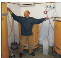
Min bobby s.15