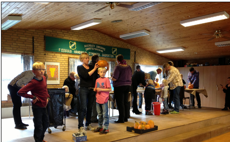
Der blev faktisk også bygget mange flotte græskarlygter på dagen med drageflyvning.