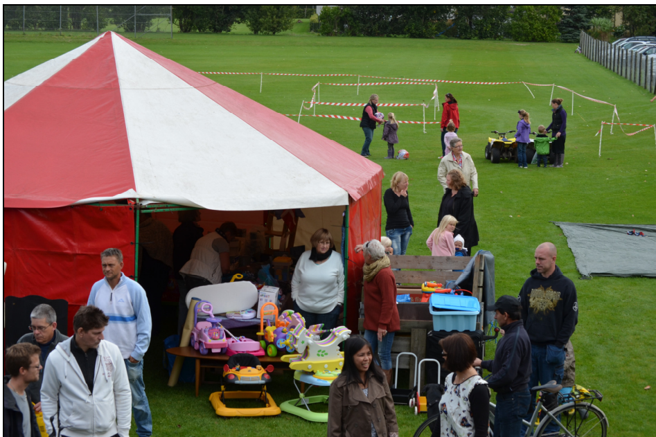
Her af de to telte med stader og motocrossbanen i baggrunden til dette års loppemarked.