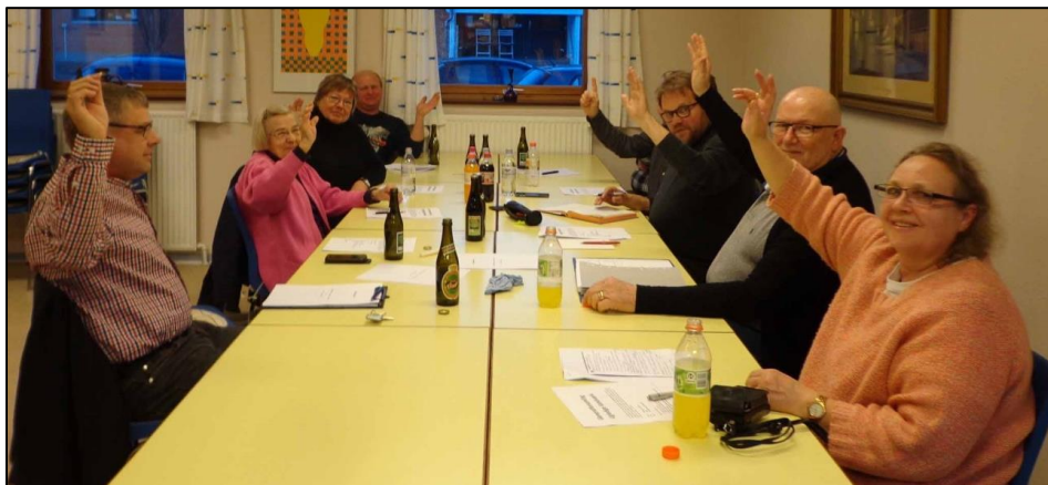
Enstemmigt JA på Ugledige vandværks generalforsamling d. 14. april til fusionering med Allerslev vandværk i 2016

Ugledige vandværk er jo fra omkring 1910 og den historie vil jeg prøve at få skrevet til næste blad.