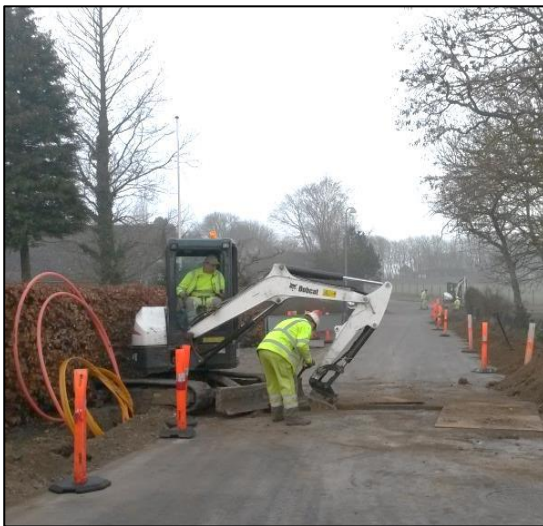
Starten på Enghavevej

Tidsplanen for etablering af fibernet er blevet ændret et par gange, men nu er de (i skrivende stund) i gang. Starten gik med opgravning på Mønvej hvor fiberen skal udgå fra en såkaldt samlingsbrønd der blev etableret i forbindelse med kloakeringen. Men desværre måtte de alligevel grave op for at lægge et nyt føringsrør, da det allerede lagte ikke kunne bruges. Så maskinerne er nu i fuld gang, hvor de her fredag d. 8. april (uge 14) via Enghavevej vil nå frem til Ugledige.