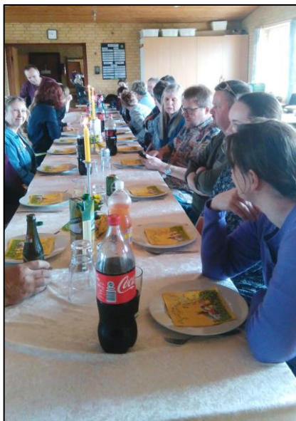
Det var en rigtig hyggelig linedance afslutning