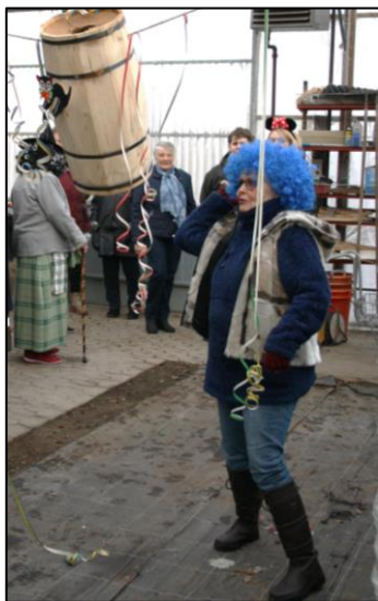
Selvom man har blåt hår, kan man sagtens give den hele armen.

Heldigvis er der da fastelavn. Der er fastelavn alle steder – supermarkeder, lokale foreninger (vores egen AUIF/Beboerforening), skoler og børnehaver. Faktisk så mange steder at børnene ikke rigtig gider have tøjet på mere efter 4. tøndeslagning. Og vi voksne forældre kigger på og klapper pligtskyldigt af de små vidunderere, der tæsker løs på den stak-