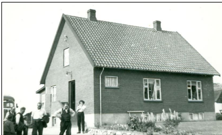
Huset færdigbygget, Rekkendevej 23