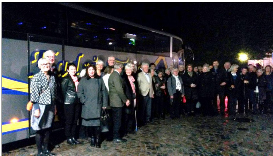
Afgang fra København fra dette års teatertur.

Sidst i januar kørte en bus fuld af teatergængere fra parkeringspladsen ved Allerslev kirke med kurs mod Bellevueteatret nord for København. Vi var mere end 50 forventningsfulde deltagere, der havde meldt sig til en omgang 'Danmarkshistorier', lige fra stenalderen til moderne tid. Det gik over stok og sten, meget blev sagt og vist, meget kunne man huske fra skolebøgerne, og vi blev meget underholdt af mange hints til nutidens problematikker. Det var meget morsomt og underholdende.