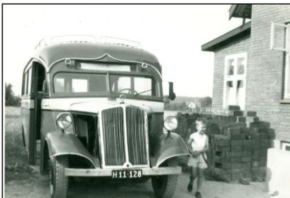
Første bus, en dansk Triangel