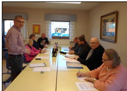
Formandens sidste beretning 2016

Det er trist at byens eget vandværk skal nedlægges, men det er en nødvendighed for at kunne opretholde den nødvendige forsyning og vandkvalitet til byens beboere. Så vi kan kun være glade og tilfredse med at Allerslev har kapaciteten til at kunne hægte os på.