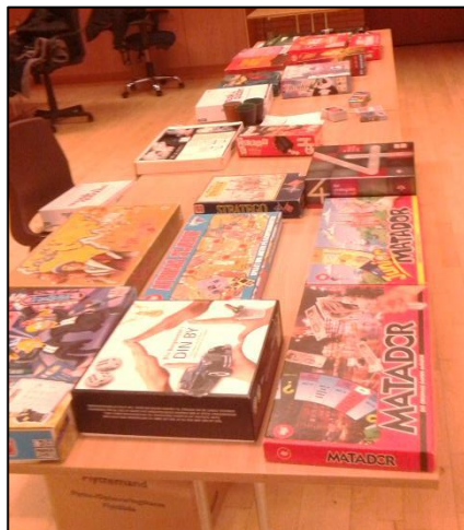
Brætspil manglede vi ikke

Det er ikke utænkeligt, at jeg kunne finde på at tage tanken op igen, men det ville da være rart, hvis der var flere, der havde lyst.