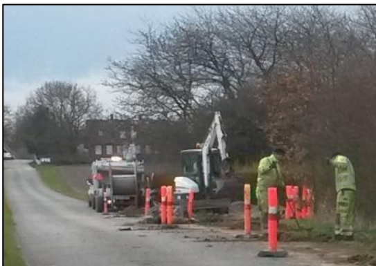
Næsten ved Ugledige 2

Alt dette er historie når du læser dette blad for planen fra Fibia pr. 26.februar var, at de ville starte uge 11 og være færdig med gravning uge 14. Tilkobling til fibernet skal starte lige efter og forventes færdig uge 19. Så da der allerede har været forsinkelse fra starten, må vi nok forvente at der ryger 1-2 uger ekstra på før tilkoblingen til alle tilmeldte er færdig.