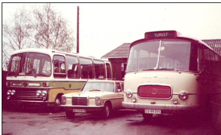
Busserne og limousinen

Forretningen blomstrede, men så sker der pludselig det ulykkelige, at min far i 1983 dør, kun 64 år. Nu stod min mor alene med ansvaret for forretningen og ansatte. Vi to sønner og vores mor måtte finde en løsning, så forretningen kunne køre videre. Løsningen blev, at firmaet blev omdannet til et Anpartsselskab, hvor min mor og jeg skulle drive forretningen, og min bror skulle fortsætte i sit job inden for militæret, der var blevet hans løbebane.