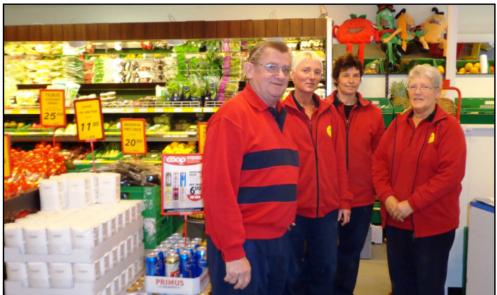
De nuværende faste medarbejdere