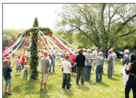
Majstangen rejses s. 19