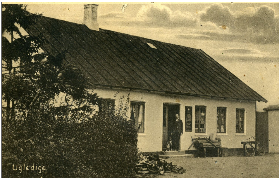
Brugsens start ca. 1880

om det er Maren ved køret eller godsejeren , så bliver alle behandlet ens der i butikken. De har altid travlt, men ikke mere end der også er plads til en lille sludder over disken, alt afhængig af køen bag dig. Og skulle du lige i farten glemme at pakke dine vare ned, så tager den gode medarbejder bare stille og roligt over, og 'vupti' så er de pakket og du er klar til afgang. Se, det er service og kundepleje ud over normalen. Hvis du er dårlig til bens eller bor lidt uden for alfa-vej , så er der også råd for det, for brugsen har udkørsel af varer flere gange om ugen og har over 80 kunder af den slags som besøges.