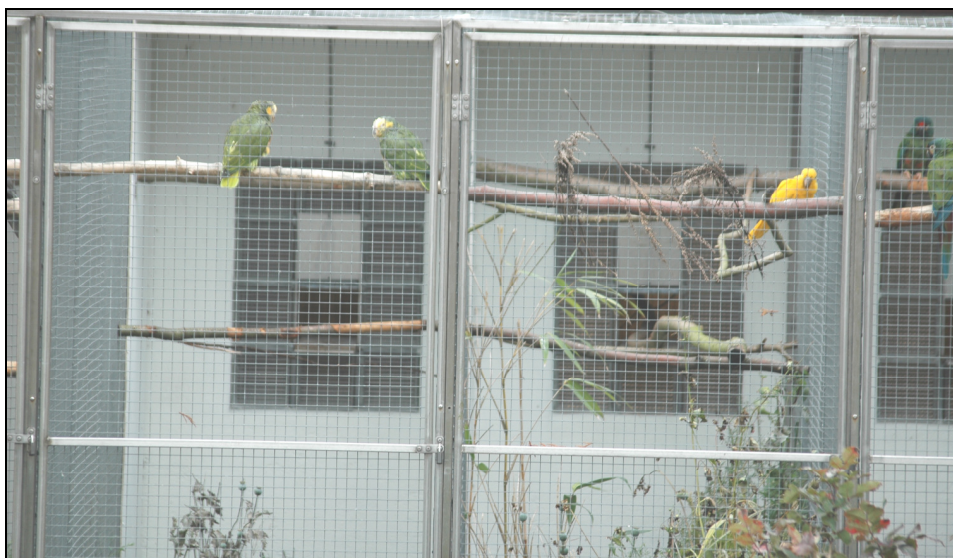
Her papegøjerne ude i december 2009

Papegøjearter kan inddeles i papegøjer eller parakitter, hvor parakitterne har lang hale. Parakitterne er normal i solsort størrelse eller duestørrelse, mens papegøjer oftest er større og har kort hale. I Danmark er der et par tusind mennesker der har den samme interesse for papegøjer som jeg, og i udlandet kender jeg mange opdrættere.