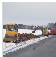
Ugledige vandværk s.6