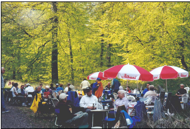
Arkinfoto fra petanque i Lekkende skoven

2010. I år prøver vi igen noget nyt, det er 'Natpetanque'. Vi starter kl.17 med aftensmad og et glas vin.