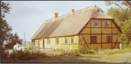
Huset i 1971 og ny istandsat

Jeg fornemmer, at hun ikke kunne drømme om at bo andre steder, selvom både hun og hendes mand kommer fra, og har boet mange år i København.