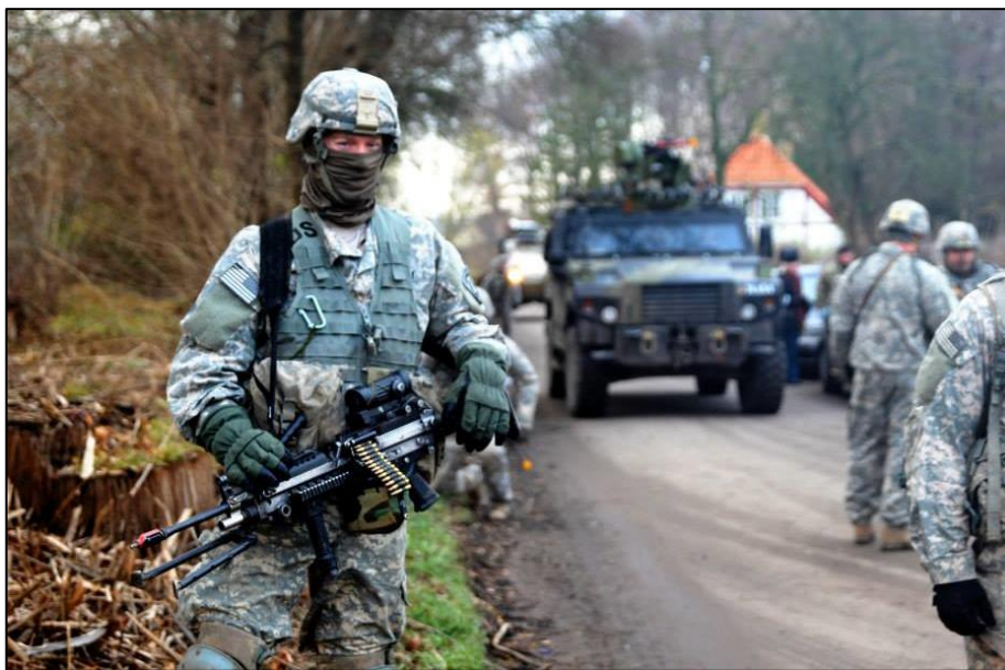
2. brigade ved Lilliendal – Foto: 2. brigade

Den amerikanske feltration består af en masse pakker med forskellige retter og en lille pose med nogle kemi-