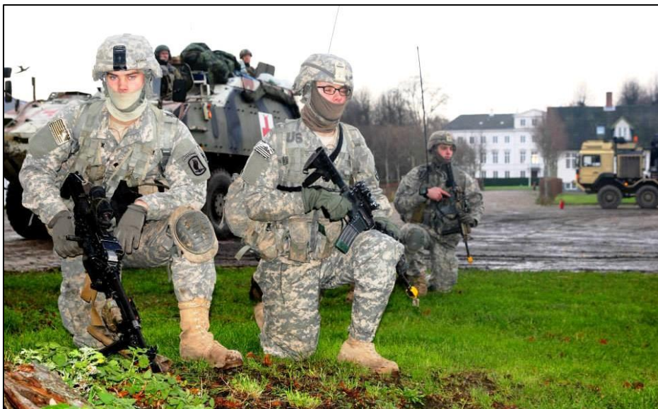
Under øvelsen skulle soldaterne bl.a. ove at stoppe demonstranter på Lilliendal.