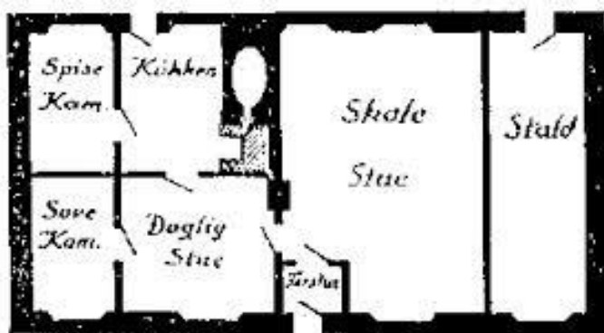
Grundplan af Fr. IV Skoler.