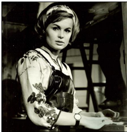
Et billede af uskyld - Ghita Norby.