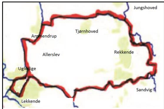
Kort over sognet

Allerslev sogns østgrænse er således vandløbet der løber ud i Jungshoved Nor. Den gode færdselsvej Jungshovedvej er kun godt 60 år gammel.