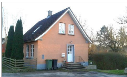
Huset på Mønvej 134 ligger der stadig