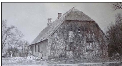
Ugledigevej 38 ved start

kakkelovn, hyggelige kroge og en hjemmevant kat, jeg aldrig så, for den gik altid sin vej, når der kom fremmede, fik jeg at vide.