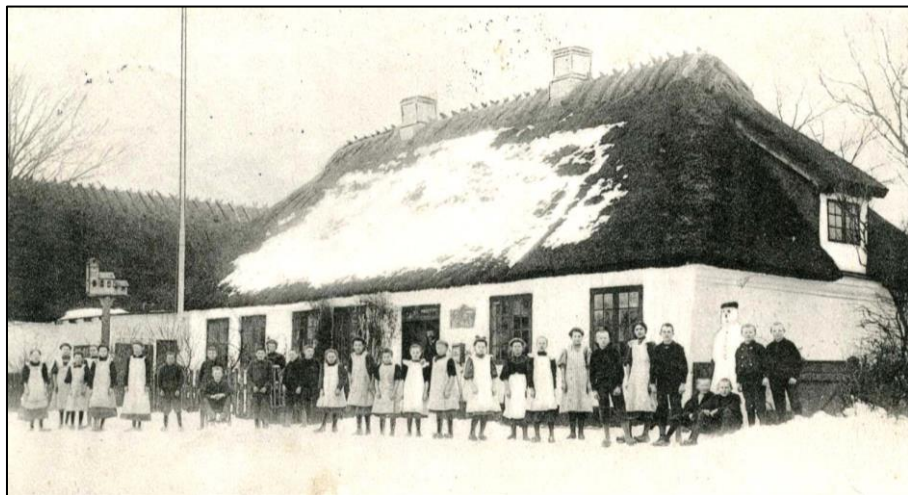
Dyrlev Rytterskole 1914