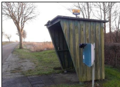
Det gamle busskur ved det gamle plejehjem

Det er dog ikke alle der endnu er blevet skiftet, men det kommer vel før eller siden.