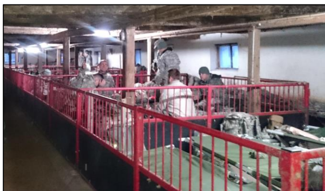
Der var godt fyldt op i den gamle grisestald, Foto Bendt Johansen

Da alle folkene var vel ankommet lørdag morgen blev de opstillet foran deres chef og givet instrukser: I er i civilt område, I opfører jer ordentligt og I skyder ikke i nærheden af gården (af hensyn til dyrene)! Der er chinchillaer i stalden som ikke tåler støj, og I holder jer ude af stalden med mindre I bliver inviteret. Så blev der ellers stillet feltsenge op i hele laden og grisestalden. Selv inde under siloen med træpiller måtte der ligge en.