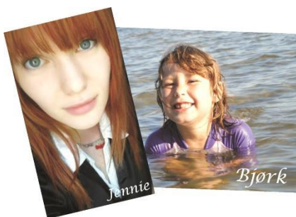
Mine 2 piger

Det er ikke kun bladet jeg har været involveret i, i AUIF. Jeg har også spillet dilettant, været opråber og tilbageråber i banko kortvarigt. Har også siddet i bestyrelsen og været formand for kulturelt udvalg. Men da jeg som voksen igen flyttede fra området, ebbede det ud.