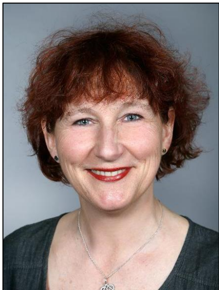
Arkiv foto: Anne Marie Krarup

Genfortælling af Selma Lagerlöfs Flammen.