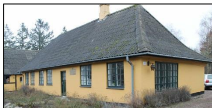
Dyrlev Rytterskole 2015

Skolen har i forbindelse med filmatiseringen af Herman Bangs "Tine" 1963/64 været kulisse i filmen.