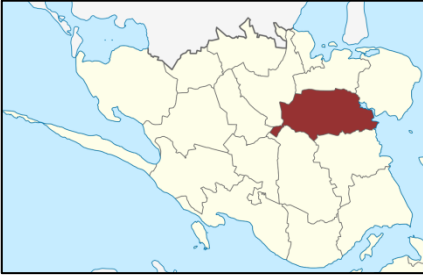
Allerslev Sogn markeret på Sydsjælland

Nogle ændringer, på landets sammenlægninger og i byernes opdelinger er der dog sket.