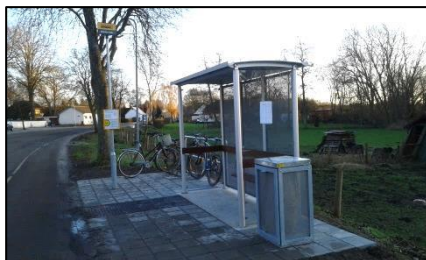
Det nye anlagte busskur ved kirken

Kommunen har nu i et stykke tid været i gang med at udskifte de gamle slidte busskurer. Det har da også været tiltrængt, da vejr og vind har sat sine spor på nogle af de gamle træskurer.