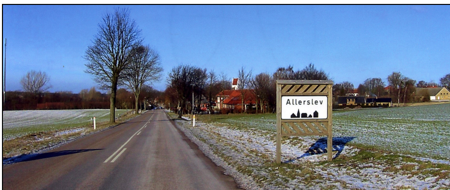
En frostklar vinterdag 2004.

Bag byskiltet var det gamle, nu rydede markskel mellem "Lovgården" og "Pilegårdens" marker