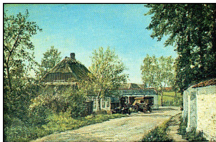
Forsiden er et maleri af Ole Ring. Billedet er af den Gamle Smedie på Røkkendervej.