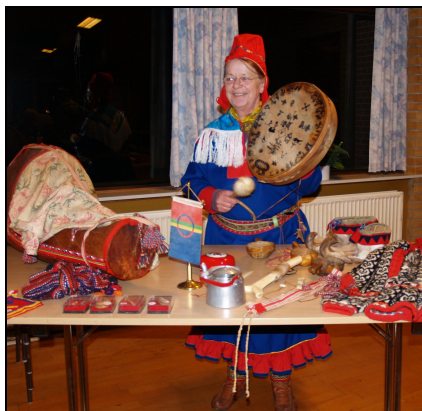
Der var håndarbejde og trommer