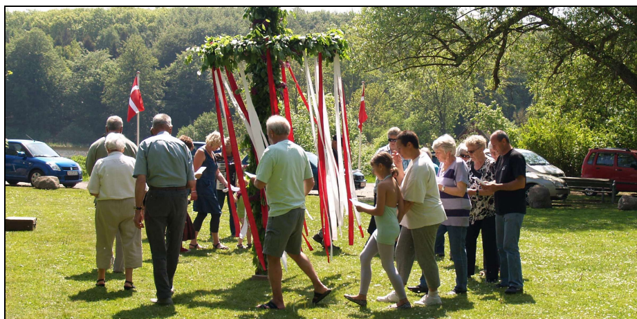
Sedvanen tro skal der dansen om majstangen.

Efter maden danser vi om Majstangen. Vi sørger for harmonikaspil i smukke omgivelser, smuk udsigt og sol fra en skyfri himmel. Så glæd dig til et par hyggelige timer, tag gerne din nabo med, vi ses .