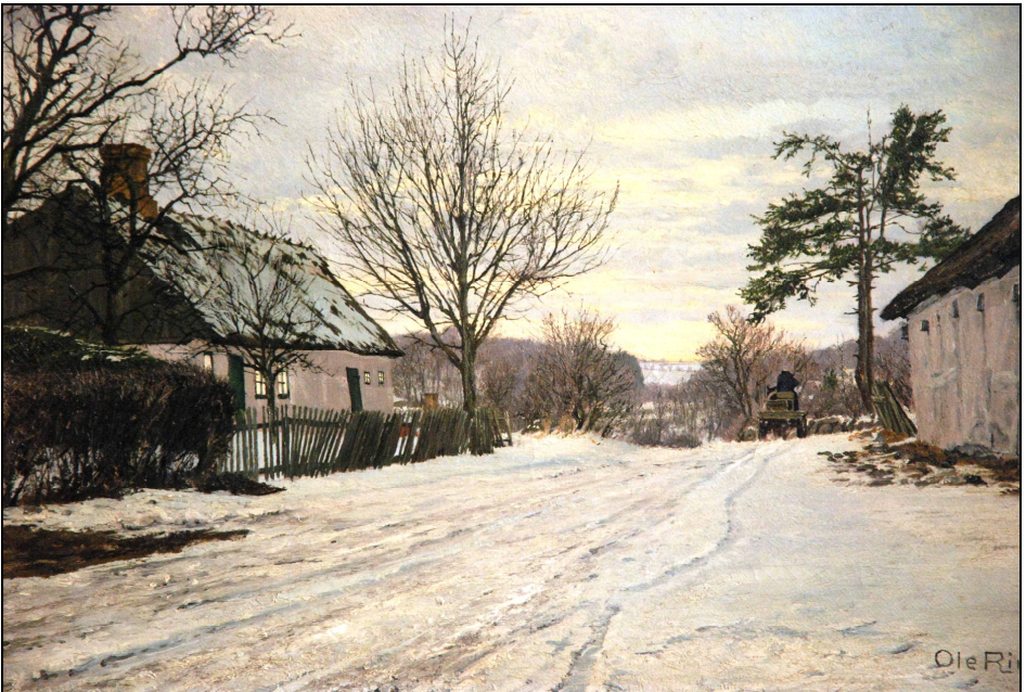
Her til venstre er det huset på Ugledigevej 17a i retning mod vest.