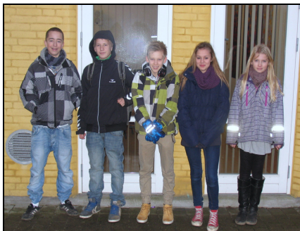
Konfirmanderne i Jungshoved