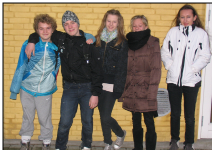
Konfirmanderne i Allerslev