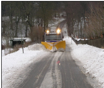
Snefoged anno 2012

Mit spørgsmål er derfor til læseren, er der nogen her der ved hvornår snekastningen i Allerslev sogn overgik fra pligt arbejde til kommunal opgave, og hvem var de sidste snefogeder?