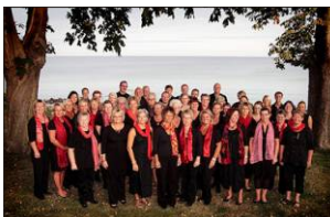
Gospelkoret Hold On