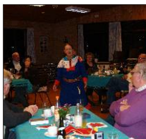
I samernes verden