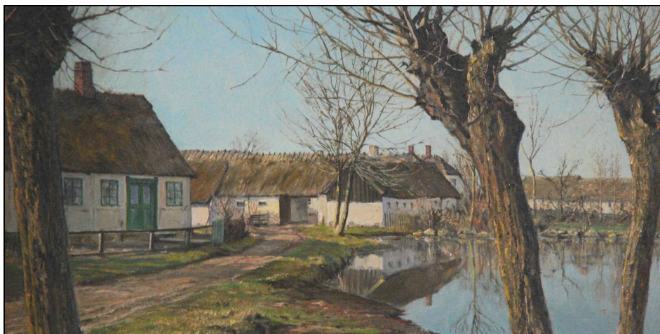
Gadekøret i Ammendrup – Malet i 1943.