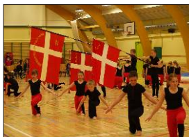
Nyt fra gymnastik