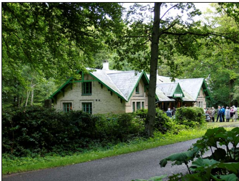
Koncertgæster på vej ind