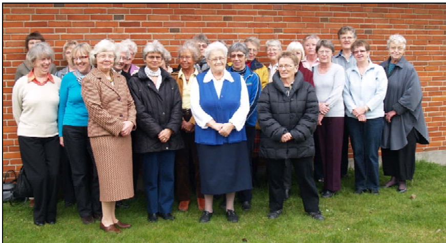
En stor gruppe glade motionsdamer

Else sagde heldigvis ja til at lede holdet igen næste vinter.