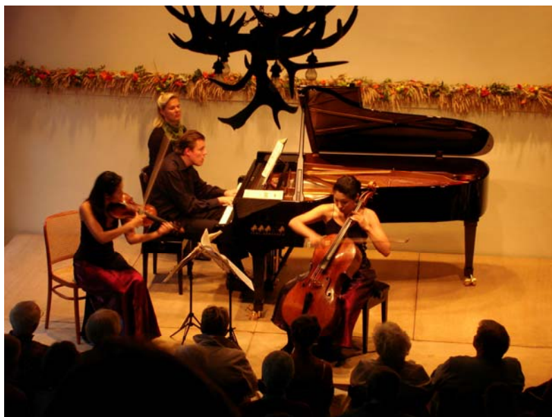
Unge musiker på podiet