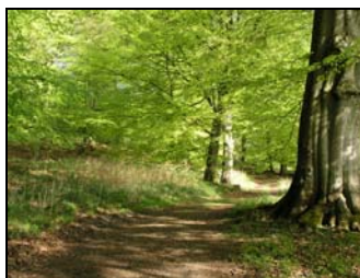
Billedet som pryder forsiden er fra Løkken-deskoven og taget af Ove Rye Jørgensen