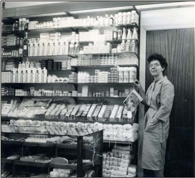
Renti efter ombygningen 1959