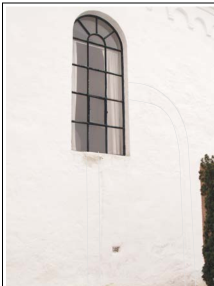
Billedet af nordmuren, hvor døren er let op- tegnet.

Senere er tårnet kommet til. I det gamle tømmer ses tydeligt, at det har været brugt før. Meget af det ser også ud, som det har været udsat for vejrlig. Måske åben klokkestabel?