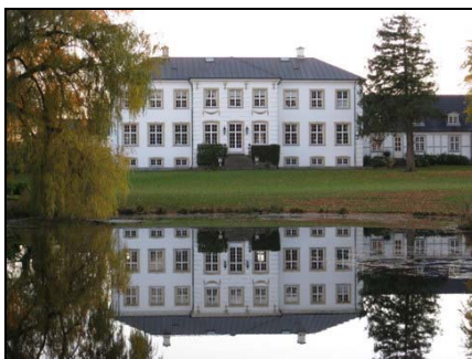
Ødemark Gods ved Sorø