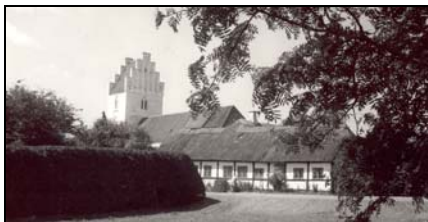
Billedet af Allerslev Kirke er udlånt fra lokalhistorisk arkiv og fotografen er ukendt.

Våbenhuset er meget yngre. Men at Kirkens klokker har lydt ved dagens begyndelse og slutning og ved sorg og glæde gennem mange generationer er sikkert.