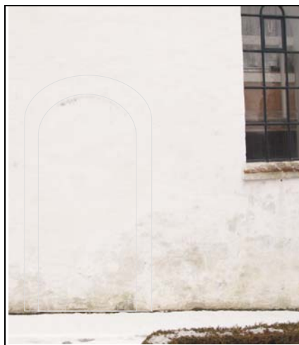
Sydmuren, og til højre for våbenbuset. Døren er let optegnet.

På nord siden ser man 2 gamle dør nicher. De kaldes kvinde døre og er fra den tid da ligeberettigelsen ikke var så stor at mænd og kvinder måtte gå ind af samme dør.