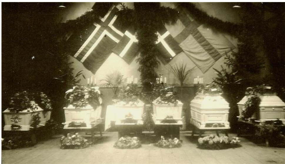
De 6 kister på Brøderup Højskole 1922

Og i en stil, der er karakteristisk for tiden skriver Aftenbladet, at Kirkens ”molstemte Klokker lyder langt over