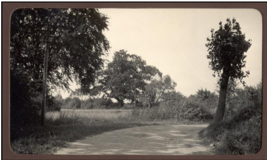
Ad Nysøvej vej mod Præsto Overdrev og på vej ind i 'Røver- eller S-svinget'.

bilen passede på en bil, der tirsdag 22.03. var blevet stjålet i Mern og siden set af flere vidner på egnen både tirsdag, onsdag og torsdag; bl.a. så Gjedde den onsdag 23.03. omkring middagstid ved det senere gerningssted, hvor røveren formentlig var ved at planlægge overfaldet.