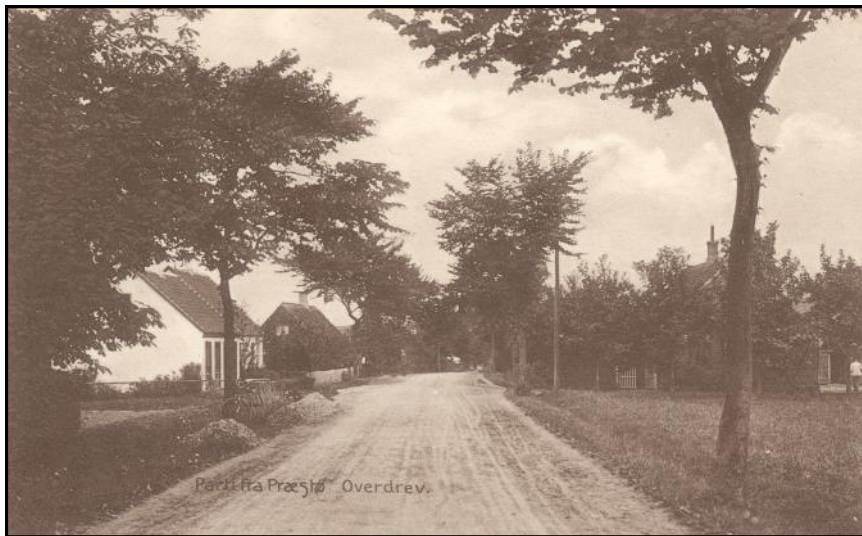
Præsto Overdev. Vejen der drejer af til højre er nok indkørslen til 'Skovlykke Mejeri'.

og da han kom til Trehjørnehuset, drejede han mod Nysø.