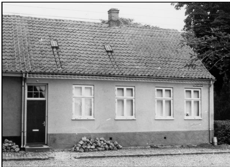
Klosternakken 23, hvor børneasylet havde til huse. P.L.A.