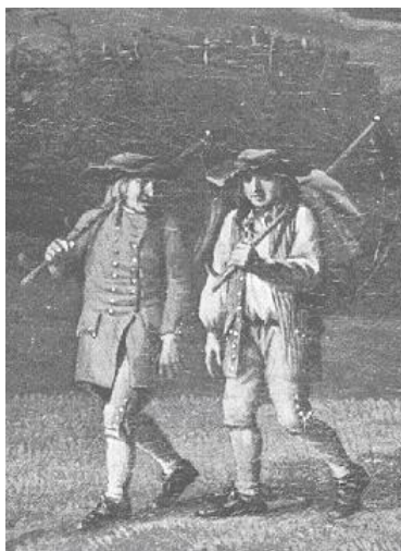
Fæstebønder på vej til arbejdet